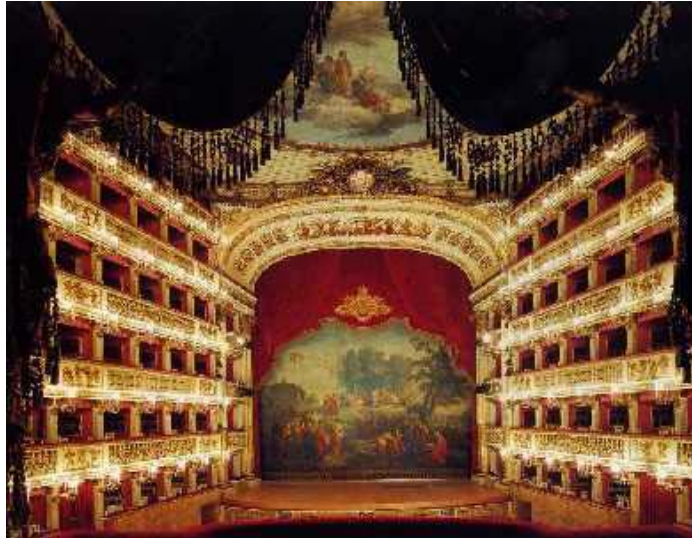
L'Opéra San Carlo de Naples

De Victor Hugo à Prosper Mérimée, de Cervantès à Antonio Garcia Gutiérrez en passant par Tirso de Molina sans oublier Beaumarchais, les écrivains et poètes qui y ont puisé leur source d'inspiration ou ont situé leurs héros en Espagne sont très nombreux. Des opéras célèbres, des opérettes et comédies musicales ont été créés à partir de leurs œuvres littéraires dont Le Barbier de Séville, Don Carlos, Don Giovanni, Carmen, Il Trovatore, La Forza del Destino, L'Homme de la Mancha. La Belle de Cadiz, La Verbena de la Paloma, La Dolores , (Tomas Bréton) et d'autres.