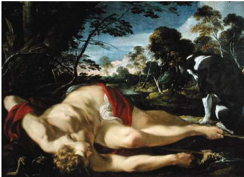
Laurent de La Hyre Adonis mort