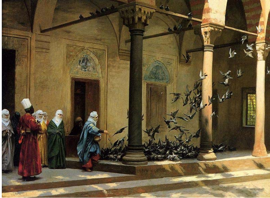
Femmes du Harem , - Jean-Léon Gérôme

Harems, l'Orient et l'amour , le 21 avril, 19 heures, Chapelle historique du Bon-Pasteur, en co-production avec le Consulat général d'Algérie