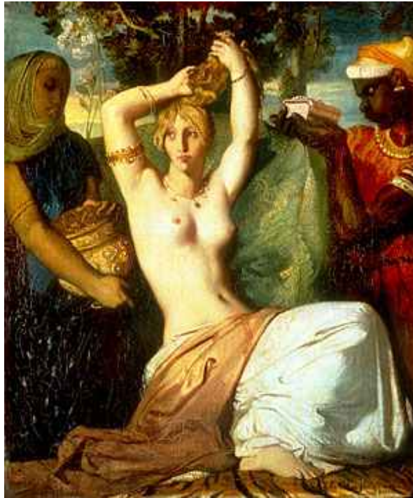
La toilette d'Esther - Théodore Chassériau