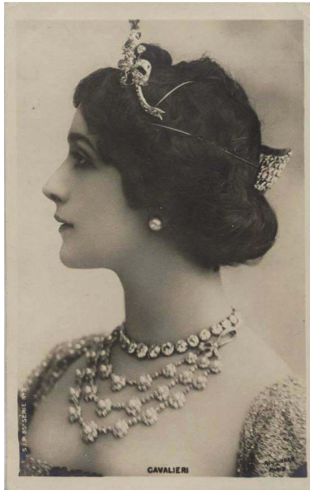
Lina Cavalieri, soprano

un hommage aux grands interprètes de l'art lyrique