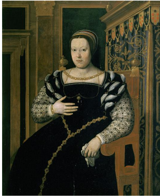
Portrait de Catherine de Médicis - Sante di Tito

Le 10 février 2009, Chapelle historique du Bon-Pasteur. En co-production avec l'Institut culturel italien