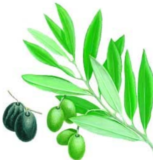
Olivier: fruit et feuille.

L'Olivier en Espagne, marqueur de paysages , le 24 novembre, 18 heures Chapelle historique du Bon-Pasteur. En co-production avec le Consulat général d'Espagne