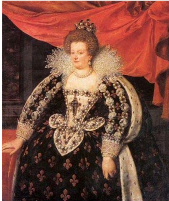
Marie de Médicis

Longtemps victime de l'opinion défavorable de Sully, de Richelieu et de Michelet, la fortune de Marie de Médicis connaît aujourd'hui une véritable réhabilitation. Marie de Médicis fut pleinement digne de son nom illustre. Grand mécène des arts, elle considérait qu'encourager tant la grande peinture que les arts décoratifs faisaient partie intégrante de l'exercice du pouvoir.