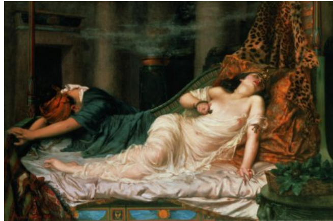
La Mort de Cléopâtre – Reginald Arthur (1892)

En partenariat avec l'Université Concordia et le Consulat général de Grèce le 25 septembre 2008, 19 heures, Théâtre D.B. Clarke de l'Université Concordia